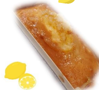
れもんパウンドケーキ 一本 500円(一本売りのみの販売)