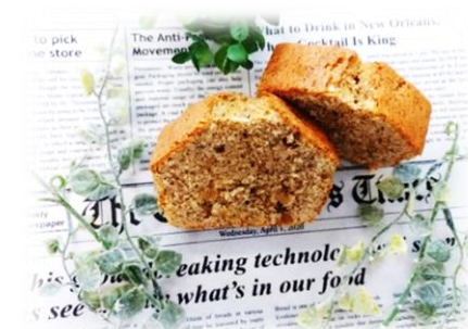
紅茶パウンドケーキ 一本 500円 一切れ 120円