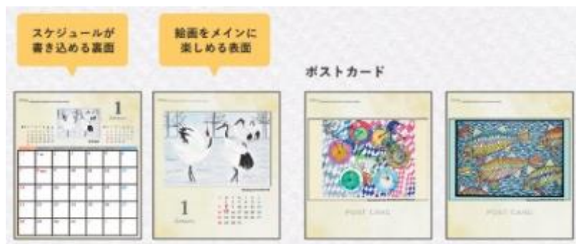
☆卓上カレンダー 1,130円 (税込)