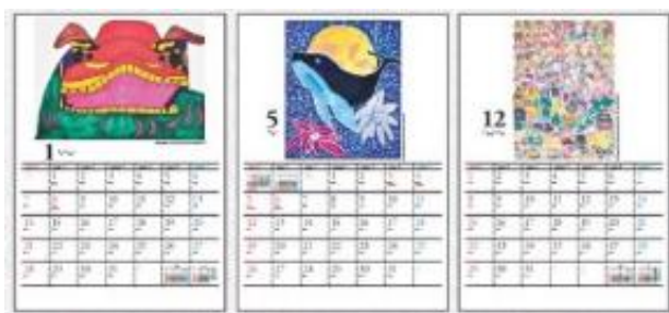
☆壁掛けカレンダー 1,350円 (税込)